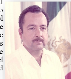
Ángel César Mendoza Arámburo

La iniciativa presidencial se aprobó por el Congreso de la Unión y, oficialmente, el 8 de octubre de 1974 nació el Estado de Baja California Sur. Lo que prosiguió, entonces, fue formar el Congreso Constituyente, representado por diputados de siete distritos electorales y facultados para elaborar la nueva constitución política del estado y los reglamentos pertinentes para la celebración de las elecciones tanto para ayuntamientos como para elegir al primer gobernador constitucional. Se enviaron dos senadores y un diputado a las respectivas cámaras; se reconfirmaron tres ayuntamientos integrados desde 1971: La Paz, Comondú y Mulegé. Asimismo, para inicios de 1975 se nombraba por sufragio al primer gobernador constitucional del estado en la persona de Ángel César Mendoza Arámburo, originario de La Paz y abogado de profesión, 28 quien había sido Secretario General de Gobierno durante todo el periodo en que se dio el proceso de reinstalación de los ayuntamientos de transformación del territorio en entidad federativa.