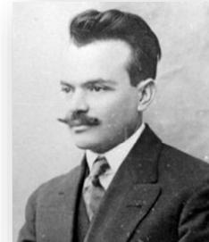
Francisco José Múgica Velázquez