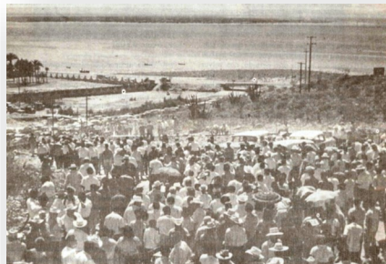
Parte del público reunido en la Colina del Sol, en una de las asambleas